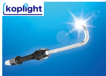
(写真1) コウプライト(koplite®)

実績として、国内市場は好評を得ており、主に形成外科、乳腺外科の手術で採用が進み、2020年までに約250施設が購入されています。海外市場はアジア・欧州・中東の11ヶ国に及んでおり、今後も販売地域を拡大しています。