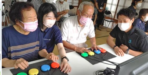
4つのボタンスイッチのみで操作