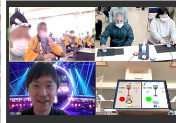
全国の福祉施設等と対戦